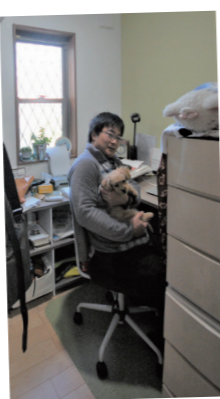
▲ご主人様こだわりの書斎

奥：主人が気になったことをさんざん質問してたけど結構無理なことを聞いてもすごくよく応えてくださって。ありがたかったね。主：模型見たりしながら説明してもらったり。