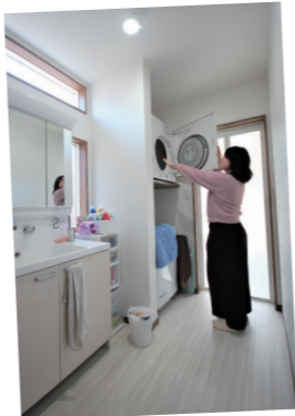
▲窓からの光で明るい洗面室。ガスを使った乾燥機「乾太くん」で家事もらくらく♪

主：金額も大手ハウスメーカーの建物の半分ちよつとなので、俺は定年迎えたらそのお金でリフォーム出来ちゃうなと思っていて、壁紙はそのうち汚くなるだろうし、って考えると、ローン返ししながらリフォームのことも考えなきゃいけないのかなと。