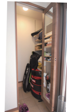
▲タイヤも置けるシューズクローク

主：自分の身の丈にあったというか、上物は変わらなくても、土地の値段で変わっちゃったなっていうのを案内してもらって理解しましたね。