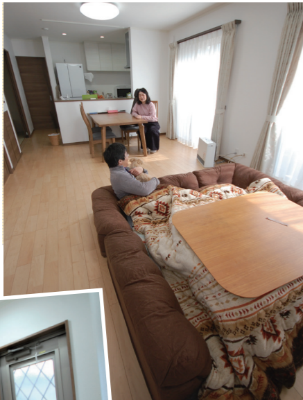
▲キッチン横パントリー。可動棚なので、ごみ箱の高さや収納ボックスの大きさに合わせて使いやすい高さに。