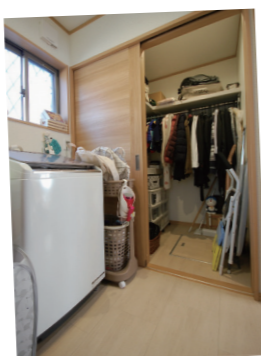
▲洗面室に1.5帖のウォークインクローゼット

— 完成を初めて見た時の感想は？ — 主：ほんとイメージ通りでした。ついに！と。 奥：うわ〜ついに出来たんだ、感動！キッ ン！お〜っ！食洗器！収納！うわ〜ついで（笑）。 — 戸建に住んで暮らしが変わったと感じ ることは？ — 主：アパートの時は駐車場が遠かったんで すよ。買い物がたくさんあると運ぶのも大 変だし、目の前の道も狭くて長く停めてお くこともなかなかできなかったんで、大急 ぎで、今は楽になりましたね。 — 奥：アパートの時は、子どもを寝かしつけた あと、扉一枚でテレビ見たり、私たちも静か