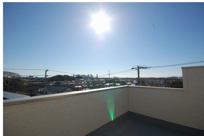
▲花火も見られるスカイバルコニーからの眺め