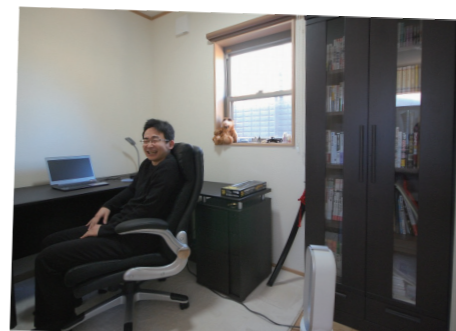
▲ご主人様お気に入りの書斎

— お問合せはどのように？ — 主：不動産検索サイトを見ていて、アパー トからも近いし立地もそこそこいいので、サ イトから問い合わせました。 — 最初に注文住宅を検討していた？ — 主：建売も3〜4件見ましたよ。でも見て るうちに、自分たちで考えた方が面白い なって思っ — 営業とのやりとりはどのように？ — 主：メールですね。結構頻繁に。 — 営業の印象は？ — 主：大変よかったです。よかつたから購入と 建築に結び付いたっていうのは間違いない と思います。