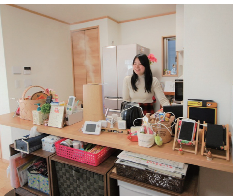
▲奥様こだわりのカウンターの広いキッチン